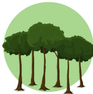
Arahan Pemanfaatan Hutan