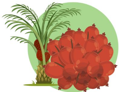
Pelepasan Kawasan Hutan