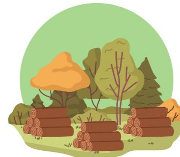
Aktivasi ex HPH