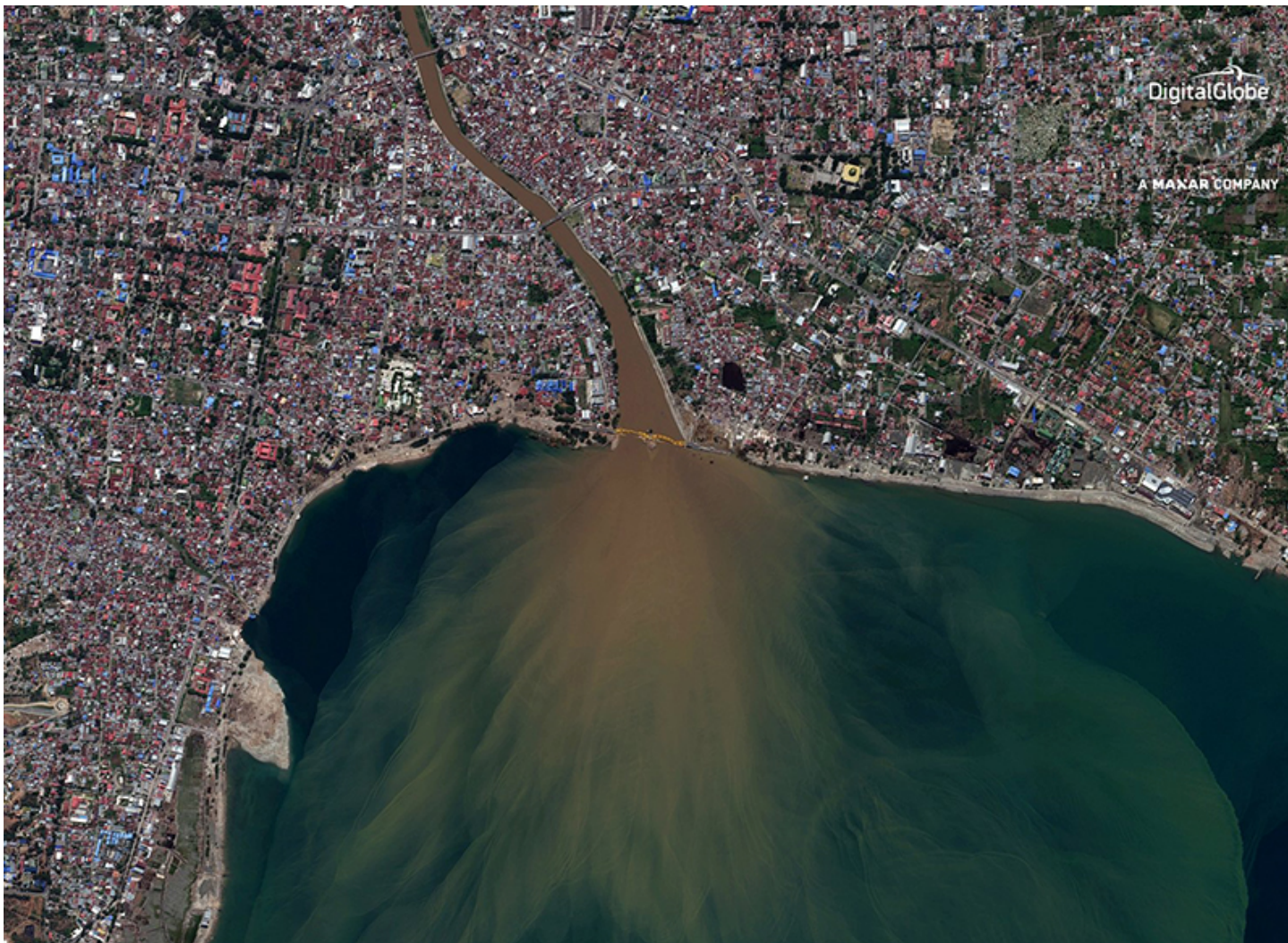
Citra satelit Teluk Palu, Sulteng, setelah likuifaksi gempa, 1/10/2018.