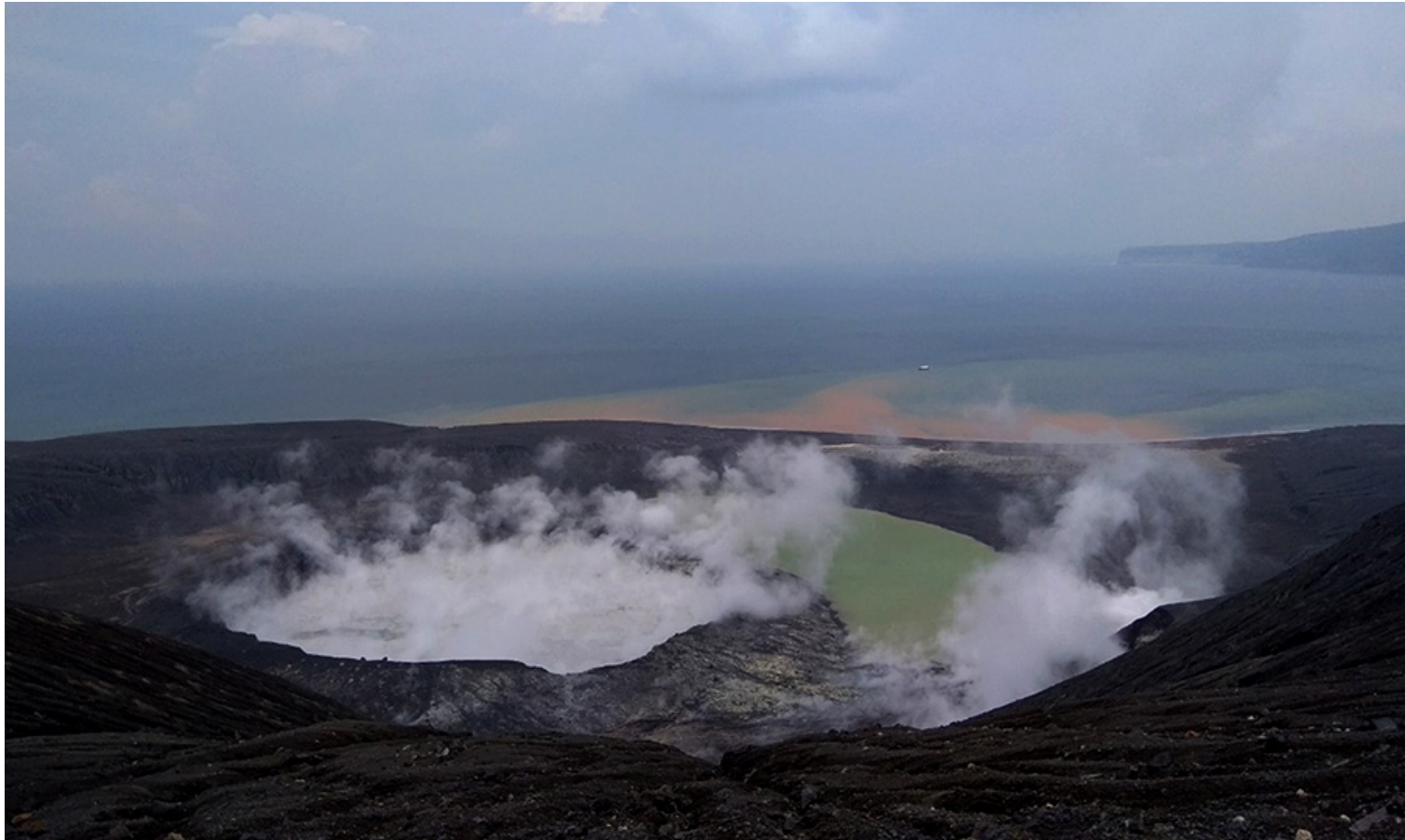
Krakatau April 2020.