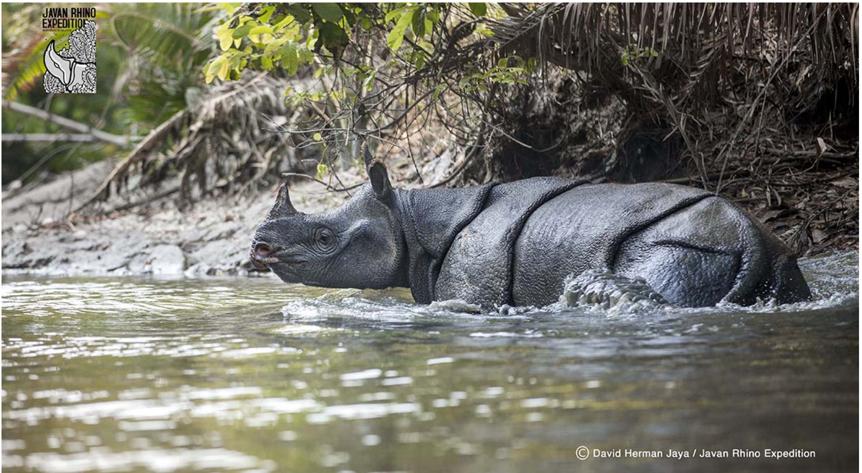
Javan Rhino.