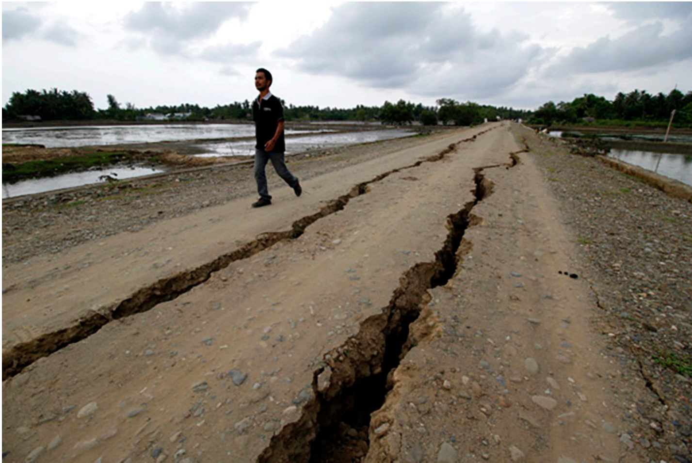
Gempa Pidie, Aceh, 2016.