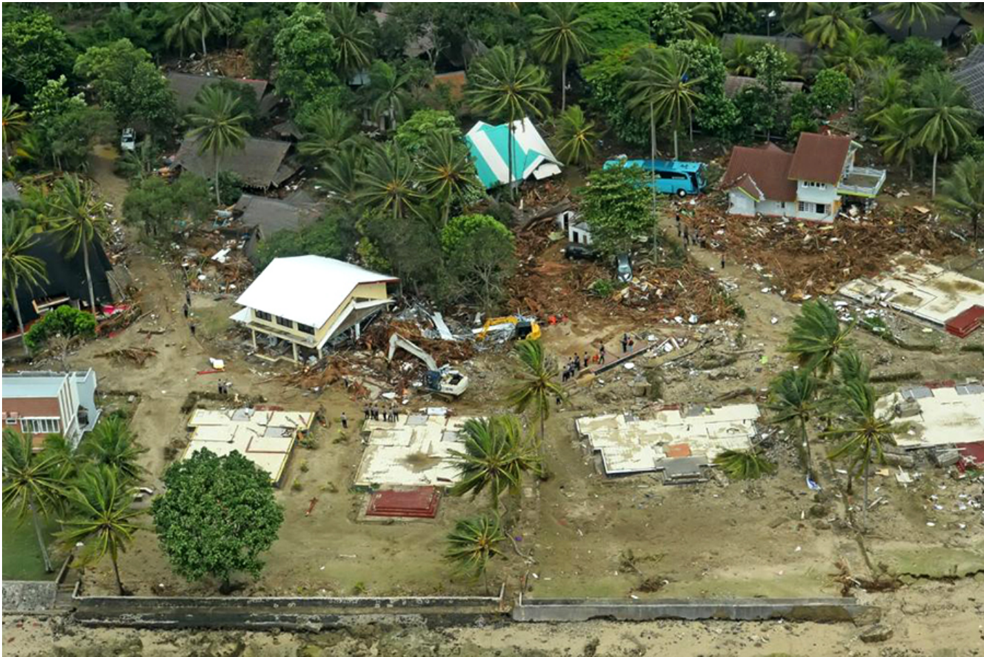
Dampak tsunami di pesisir Banten 2018.