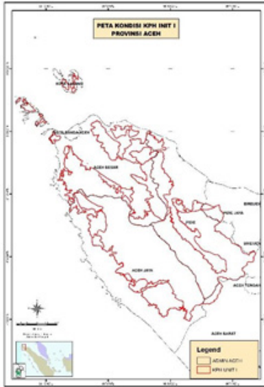
Gambar 2. Peta Wilayah KPHL Unit 1 Aceh

seluas 376.487,07 hektare (66,42%); Hutan Produksi Terbatas seluas 80.725,74 hektare (14,24%) dan Hutan Produksi seluas 109.630,87 hektare (19,34%) 7 .